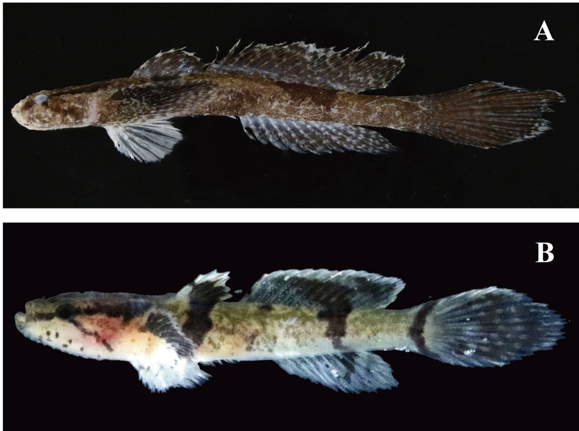
Fig. 1. Preserved specimens of Callogobius tanegashimae from Wakasa Bay, Sea of Japan. (A) FAKU 146894, 56.8 mm SL; (B) FAKU 148204, 20.4 mm SL.

体は細長く、頭部は縦偏するが、胸鰭基底の位置から側偏する (Fig. 1)。頭部は尾鰭長や胸鰭長より短い。頭部の孔器列は発達し、横列皮摺を形成する (Fig. 2)。左右の鼻孔間に横列皮摺 (孔器列 2)、眼の後方に横列皮摺 (孔器列 17) がみられる (Fig. 2A)。頬部下部を縦方向に走る孔器列 14 と 15 は、孔器列 8 と 9 の間で中断しない (Fig. 2B)。頭部腹面に位置する孔器列 16 は 12 短横列からなる (Fig. 2C)。孔器列 20 はない。口は小さく上を向き、その