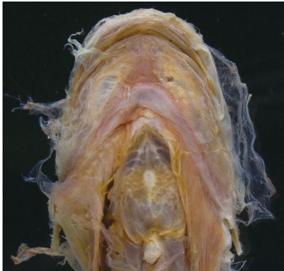
Fig. 3. Ventral view of head and anterior part of body of Osteodiscus andriashevi , NSMT-P 97212.

致したが、 O. cascadiæ (51–56, 47–52, および 40–44) と O. rhepostomias (51–55, 46–47, および 41–44) とは異なった (Stein, 1978, 2012; Pitruk and Fedorov, 1990). 以上から、本標本は O. andriashevi に同定された. なお、本標本と O. andriashevi のタイプ標本では脊椎骨数と背鰭条数に1ずつの相違が認められた. しかし、両形質におけるこの程度の相違は、同属の O. cascadiæ で報告されているため (Stein, 1978), 本研究でも前述の相違を種内変異として扱った. また、本標本と O. andriashevi のタイプ標本では頭部の色彩もやや異なっていた [本研究の標本では淡い茶色 (Fig. 1) vs. タイプ標本では黒色 (Fig. 4)]. しかし、本種と同じ深海性クサウオ科であるコンニャクウオ属のザラビクニン Careproctus trachysoma Gilbert and Burke, 1912b などでも、このような色彩変異が知られているため (Orr et al., 2015), ここでも種内変異の範疇であると見な