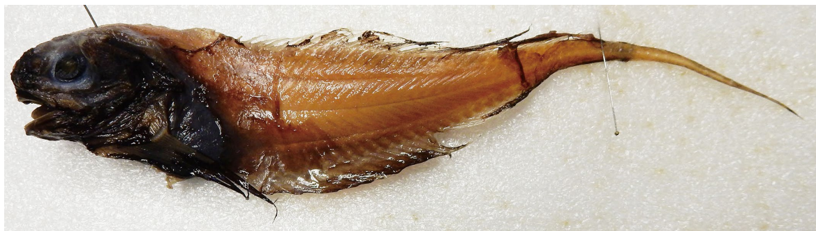
Fig. 4. One of the paratype specimens of Osteodiscus andriashevi , ZIN 49565, 165 mm SL, female.

した. ただし、両標本は採集されてから約 30 年が経過していることから、保存中の褪色によってこのような違いが生じた可能性も考えられる.