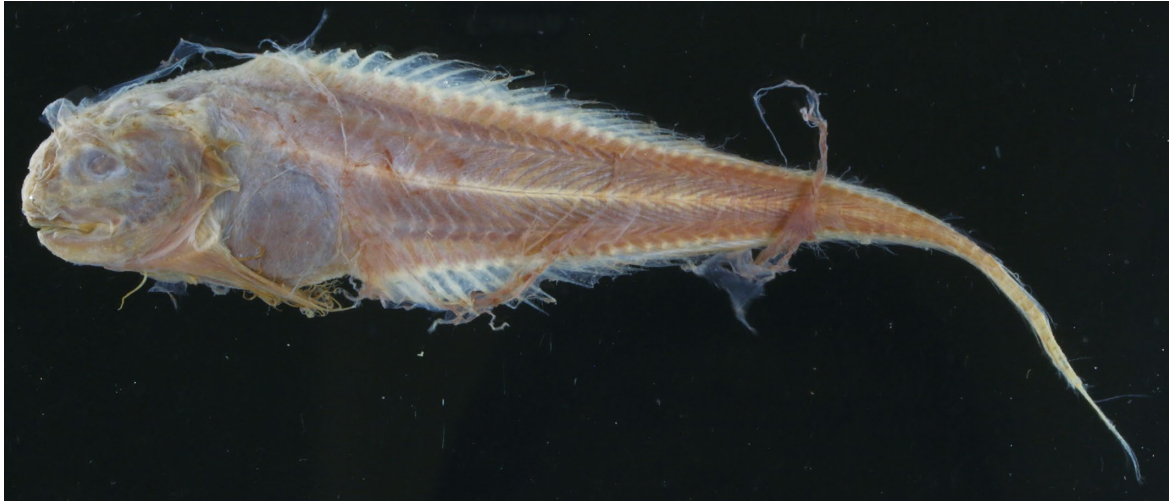
Fig. 1. Lateral view of Osteodiscus andriashevi , NSMT-P 97212, 150.3 mm SL, female.