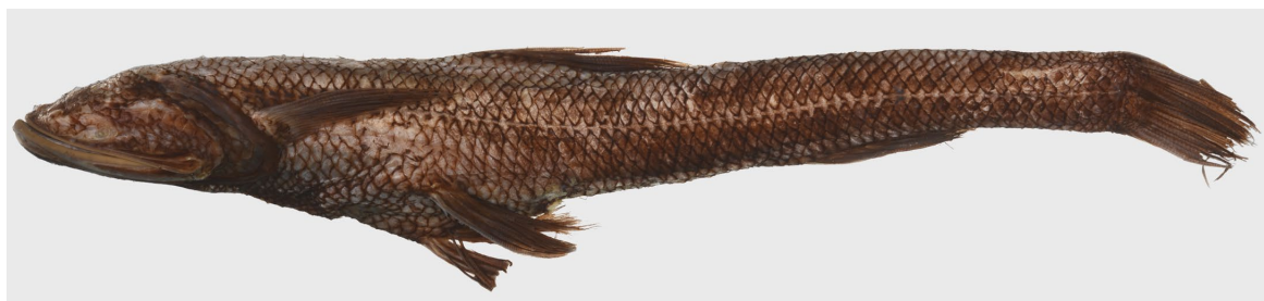
Fig. 1. Preserved specimen of Bathytyphlops marionae , BSKU 27528, 321.9 mm SL, Okinawa Trough.

記載標本 3個体(沖縄舟状海盆): BSKU 20220, 297.3 mm SL, 27°48.8'N, 127°27.0'E, 水深1380 m, ビームトロール, 蒼鷹丸, 1972年2月7日; BSKU 26354, 321.9 mm SL, 緯度経度と水深は不明, 底曳網, 1978年1月20日; BSKU 27528, 322.1 mm SL, 28°43.0'N, 127°14.0'E, 水深750–755 m, 底曳網, 第