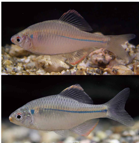
図1. 遠賀川水系産カゼトゲタナゴ(上)と旭川水系産スイゲンゼニタナゴ(下)。

ここで取り上げるコイ科タナゴ亜科バラタナゴ属カゼトゲタナゴ類は、九州北部に分布するカゼトゲタナゴと山陽地方に生息するスイゲンゼニタナゴを指す(図1)。これらは、従来別亜種として取り扱われてきたが、最新の魚類検索図鑑ではそれぞれがカゼトゲタナゴ北九州個体群、同山陽個体群とされている(細谷, 2013)。しかしながら、少なくとも両者の間には保全・保護の現状や課題を理解する上で無視できない大きな相違が存在する。それは、後者が絶滅のおそれのある野生動植物の種の保存に関する法律(種の保存法)の指定種である点である(森・片野, 2005)。このことから、これらの保全・保護の現状と課題を理解するためには、両者を分けて考える必要があると思われる。なお、両者の学名には現在